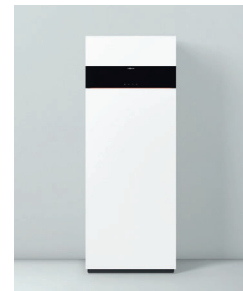
Vitodens 222-F Typ B2SF