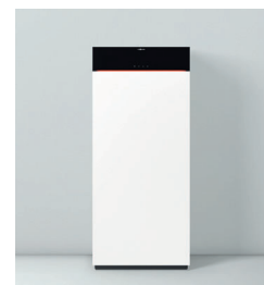
Vitodens 222-F Typ B2TF