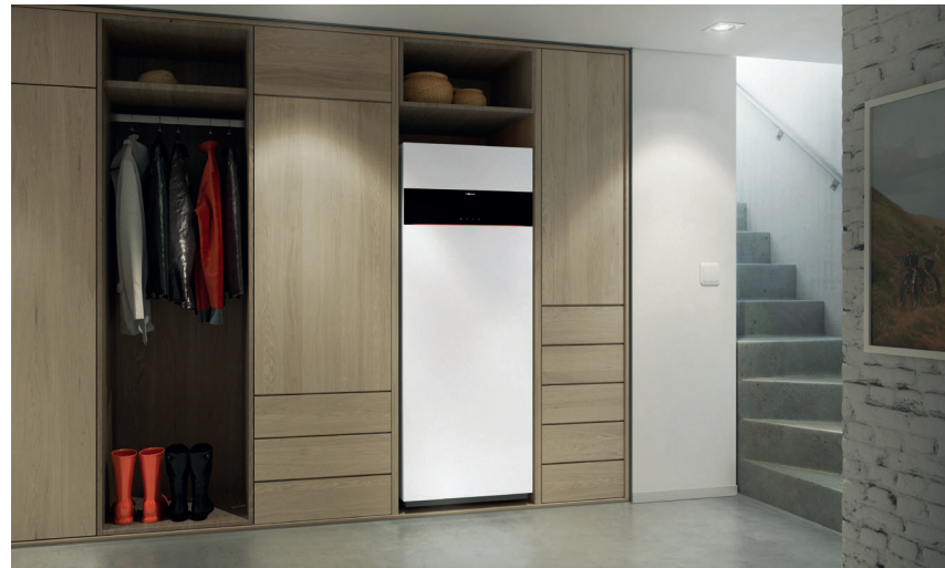
Vitodens 222-F mit attraktivem Design in der Farbe Vitoppearlwhite